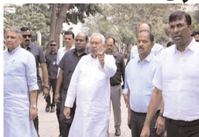
बेहतर ढंग से कराया जाए बिहार गौरव पार्क का निर्माण

पटना में बांस घाट के पास लोकनायक जय प्रकाश नारायण पार्क का निर्माण लोकनायक के सम्मान में किया जा रहा है। कुमार ने निरीक्षण के दौरान अधिकारियों को निर्देश दिया कि भारत के प्रथम राष्ट्रपति देशरत्न डॉ. राजेन्द्र प्रसाद की समाधि स्थल के पास इस पार्क का निर्माण बेहतर ढंग से कराए। उन्होंने कहा कि इस पार्क के निर्माण से इस क्षेत्र के लोगों को काफी फायदा होगा। इस थीम पार्क के एक तरफ देशरत्न डॉ. राजेन्द्र प्रसाद का समाधि स्थल है, वहीं दूसरी ओर जेपी गंगा पथ अवस्थित है, यहां का दृश्य काफी मनोरम