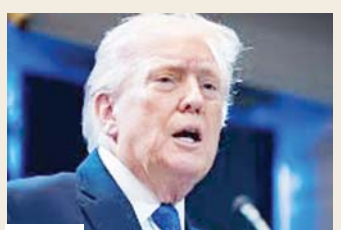
तेल परिवहन हेतु अमेरिका की नौसैनिक नाकाबंदी को तत्काल प्रभाव से हटाने का भी आदेश देता हूँ। दुनिया भर के जहाज अब अपनी यात्रा शुरू करें। - डोनाल्ड ट्रंप, राष्ट्रपति, अमेरिका