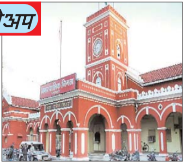
सकता है कि लगभग तीन माह पूरे बीत जाने के बाद भी नगर निगम प्रशासन ने एक भी पेंडिंग लीज को फाइल नहीं निपटाई। ऐसे में

विधायक के प्रश्न का जबाब देते हुए नगरीय विकास एवं आवास मंत्री कैलाश विजयवर्गीय ने आश्वासन भी दिया कि सिर्फ जबलपुर ही नहीं बल्कि पूरे प्रदेश में जितने भी लीज से जुड़े प्रकरण लंबित हैं, तीन माह के अंदर उनका समाधान कर दिया जाएगा लेकिन हेरत की बात यह है कि मंत्री की इन बातों पर जिम्मेदारों पर कोई असर नहीं पड़ा। जिसका अंदाजा इसी बात से लगाया जा