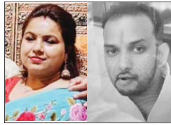
आत्महत्या कर ली। गोली चलने की आवाज सुनकर आसपास के लोग