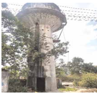
कोतमा में जल संकट का दृश्य।

कोतमा, देशबन्धु। भीषण गर्मी के बीच नगर के वार्ड क्रमांक 13 में पेयजल संकट गहराता जा रहा है। एएसईसीएल जमुना-कोतमा क्षेत्र के अंतर्गत आने वाले इस वार्ड में स्थित पानी की टंकी जर्जर हालत में पहुंच चुकी है, जिसके चलते सैकड़ों परिवारों को पानी के लिए भारी परेशानियों का सामना करना पड़ रहा है। स्थानीय लोगों का आरोप है कि बार-बार शिकायतों के बावजूद एएसईसीएल प्रबंधन ने समस्या के समाधान की दिशा में कोई ठोस कदम नहीं उठाया।