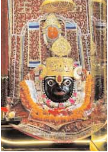
सतना, देशबन्धु। ज्येष्ठ माह की सोमवती अमावस्या पर सोमवार को धर्मनगरी चित्रकूट सहित बिरसिंहपुर के

विष्णु को समर्पित है। हिंदू पंचांग में लगभग तीन वर्ष में एक बार आने वाला यह महीना विशेष पुण्यदायी माना जाता है। इस दौरान किए गए जप, तप, दान, व्रत और पूजा का फल कई गुना अधिक प्राप्त होता है यही वजह है कि काफी संख्या में लोग पहुंचते हैं।