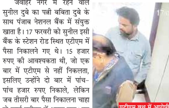
एटीएम बूथ में आरोपी