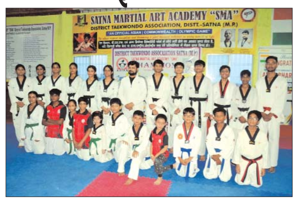
सतना, देशबन्धु। सागर में मध्यप्रदेश ताइक्वांडो संघ द्वारा